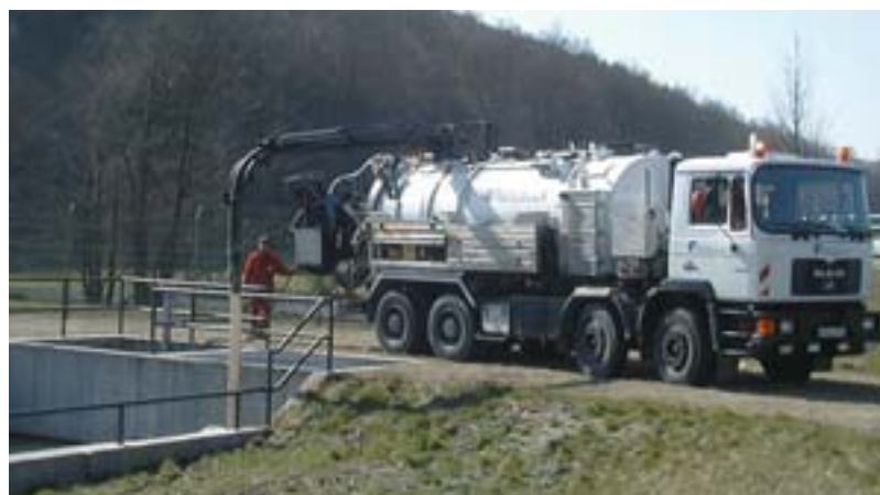
Reinigung eines Regenrückhaltebeckens

Die Zusammenarbeit mit kan.d.i.s bei der Kanalreinigung garantiert den Einsatz ausgereifter und leistungsfähiger Technik.